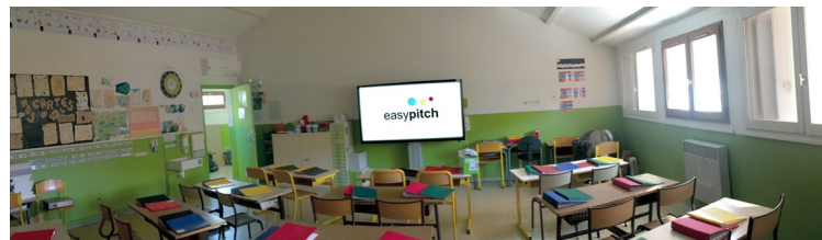
Tableau numérique, interactif