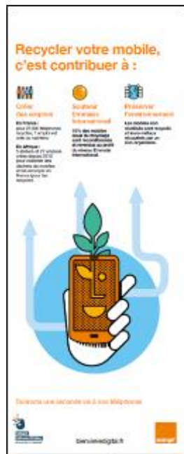
Roll up 80x200cm Infographie