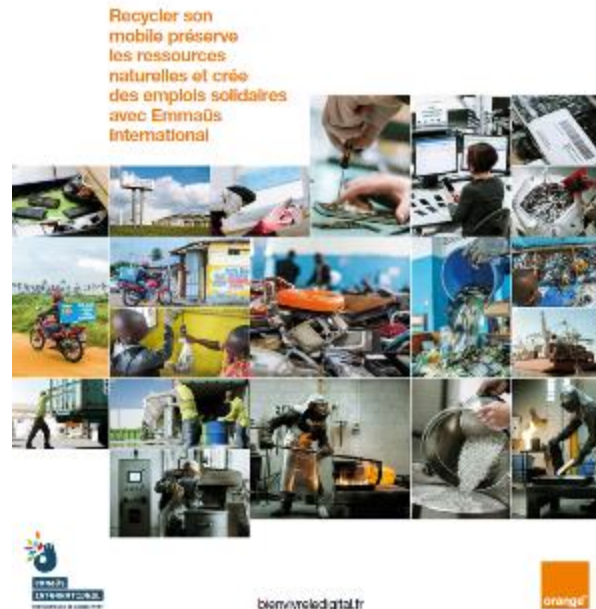
Stand parapluie ( dim.224X224 cm)

Le stand illustre le traitement et le reconditionnement des mobiles, la collecte des déchets de mobiles en Afrique et le traitement en France des déchets en provenance d'Afrique.