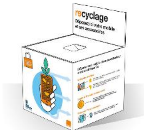
Dim: 30x30 cm Poids max:12 Kg