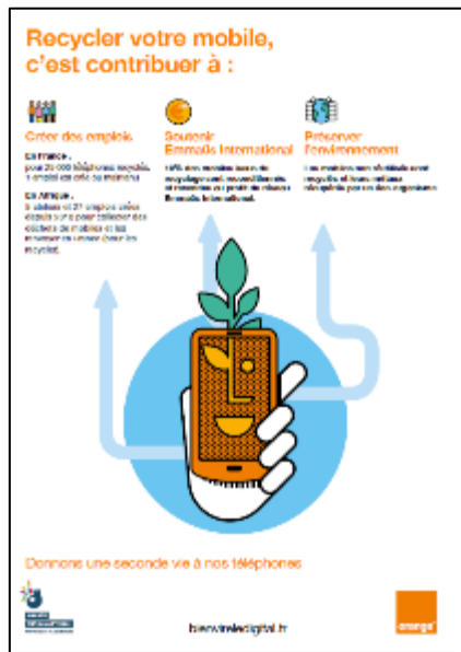
Affiche 40x60 cm infographie

Ces affiches sont disponibles sur le site https://www.collecte-mobile.orange.fr/documents/affiches