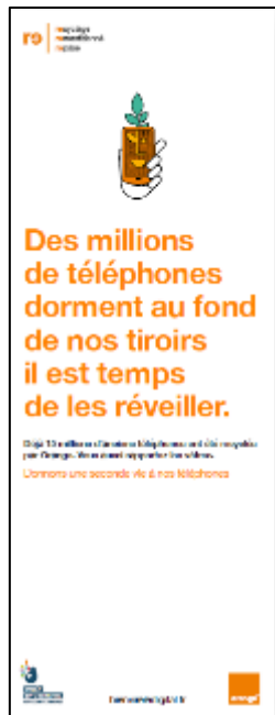
Kakemono 60X160 cm Générique