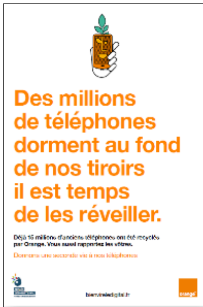
Affiche 40x60 cm Générique